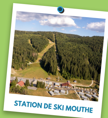
STATION DE SKI MOUTHE