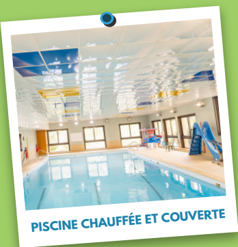
PISCINE CHAUFFÉE ET COUVERTE